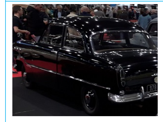
Ford Taunus 17M P2 1959 (Production de 1957 à 1960) :