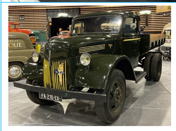
← Camion Ford V8