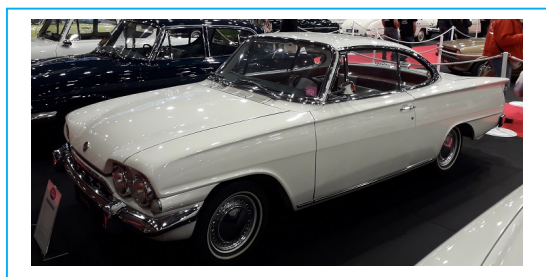
Ford Consul Classic 315 1964 (Production de 1961 à 1964) :