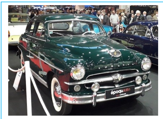
Ford Versailles, Marly, Régence et Trianon 1954 (Production de 1954 à 1957, les modèles issus de la Versailles ont ensuite été repris par Simca après la cession de l'usine SAF) :