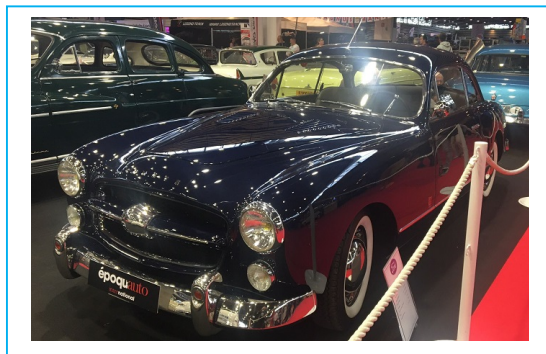
Ford Consul cabriolet Mk2 1960 (Production de 1956 à 1962) :