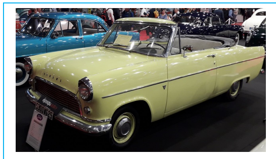
Ford Consul 315 Coupé Capri 1963 (Production de 1961 à 1964) :