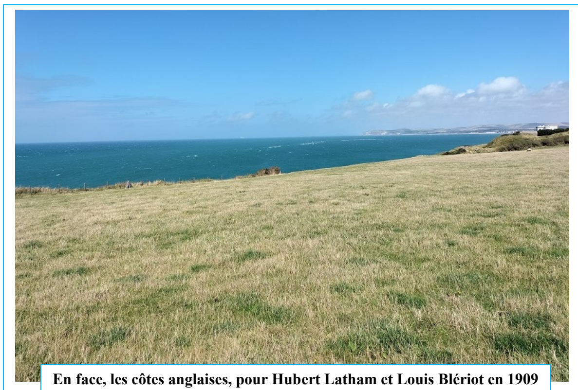
En face, les côtes anglaises, pour Hubert Latham et Louis Blériot en 1909